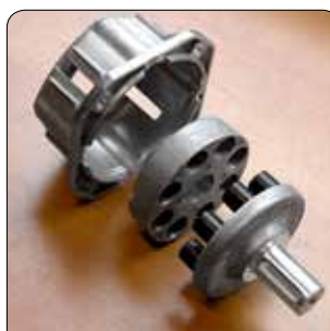
Giunto elastico incorporato per un migliore accoppiamento pompa/motore

• Motore elettrico a 4 poli (1450 RPM) con protezione termica e raffreddamento ad acqua • Gruppo pompa lineare con testata in ottone nichelato e tenute ad alta temperatura, 3 pistoni in ceramica e valvola by-pass • Total Stop ritardato a bassa tensione • Valvole aspirazione e mandata in acciaio inox • Caldaia verticale con serpentina in acciaio ad alto rendimento termico • Motore ausiliario per ventilazione caldaia e pompa gasolio con by-pass di scarico • Regolatore della temperatura con sensore in acciaio inox ad alta sensibilità • Spia di riserva del gasolio con interruzione di flusso • Valvola di sicurezza • Vaschetta di alimentazione acqua con dispositivo anticalcare • Pannello di controllo con comandi in bassa tensione • Doppio ugello Inox AISI 303 in dotazione.