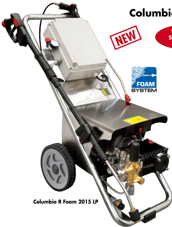
Columbia R Foam 2015 LP